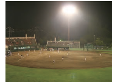
ナイトゲームもできる野球場 Baseball Ground