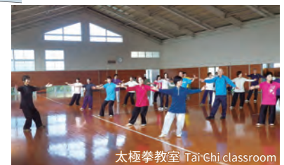
太極拳教室 Tai-Chi classroom

宮崎市佐土原武道館 Sadowara Budokan 施設/剣道2面、柔道1面 柔道・剣道・空手・薙刀等の武道、ダンス等に 使用できます。 Facilities / 2 Kendo, 1 Judo For you can use for martial arts, judo, kendo, karate, naginata, and dance.