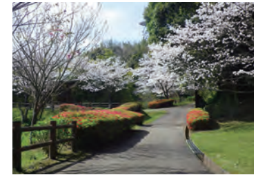
ハイキング気分が楽しめる遊歩道 Promenade