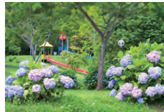
6月上旬 アジサイ Early June Hydrangea macrophylla

久峰公園・武道館の各施設使用料金、使用方法等の詳細は管理事務所までお問合せください。 Please feel free to ask our administration office about details of usage fees and method.