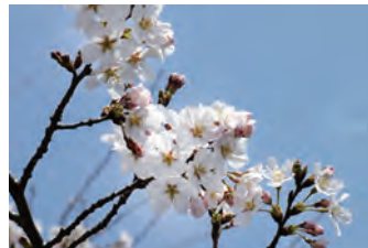
3月下旬 ソメイヨシノ Late March Prunus × yedoensis