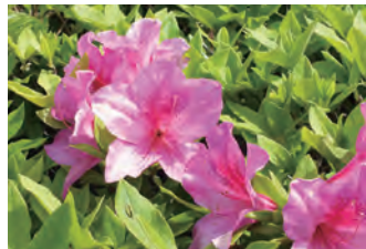
4月下旬 ヒラドツツジ Late April Rhododendron × pulchrum