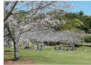
思い思いの利用ができる多目的広場 Multi-purpose open space