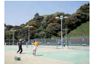
テニスコートは連日大人気 Tennis court