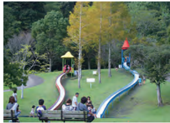
人気の高いローラー滑り台 Roller slide

Hisamine General Park, is a famous spot for cherry blossoms. This 24ha park include a multipurpose open space, picnic open space, adventure open space, 8 tennis courts, archery ground, putter golf course, athletics stadium, grass skiing area, observation deck, walking path, baseball field, you can enjoy sports, walks and picnics with your family.