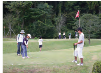
みんなで楽しめるパターゴルフ(ミニパークゴルフ) Putter golf course (Park golf course)