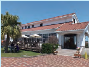
マリンセンター Marine center