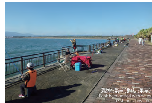
親水護岸(釣り護岸) Bank harmonized with water (Fishing is possible)