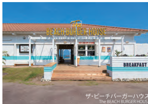
ザ・ビーチバーガーハウス The BEACH BURGER HOUSE