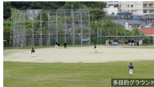
多目的グラウンド