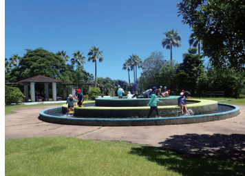
遊戯広場(じゃぶじゃぶ池) Recreation Plaza (Jabu-jabu pond)