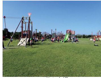
ソテツ広場 Sotetsu open space