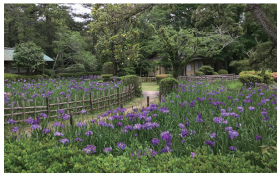
[5月下旬] ハナショウブ(日向景修園) Iris (Hyuga Keisyuen)