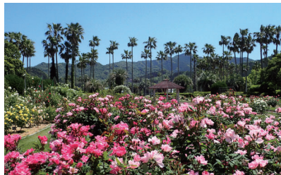
[5月初旬・10月中旬] バラ(バラ園) Rose (Rose Garden)

バラ園 (入園料) 無料 (開園時間) 9:00~17:00 Rose Garden (Admission) free (Opening hours) 9:00a.m.~5:00p.m.