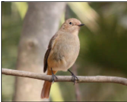
ジョウビタキ(メス)

冬になるとよく見られるジョウビタキがやって来ました。この愛らしい鳥がやって来ると、冬も近いのかな……おっと、まだ秋にもなりきっていないですね。