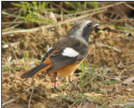
現れたジョウビタキ(オス)

冬になるとよく見られるジョウビタキがやって来ました。この愛らしい鳥がやって来ると、冬も近いのかな……おっと、まだ秋にもなりきっていないですね。