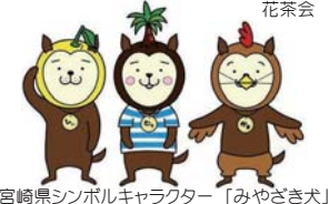
宮崎県シンボルキャラクター「みやざき犬」