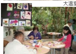
ブーゲンビリアの押し花づくり