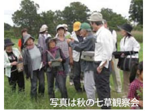
写真は秋の七草観察会

電話・FAX・E-mail・このはな館にて直接申込のいずれか 指定管理者 一般財団法人みやざき公園協会 県立阿波岐原森林公園管理事務所 電話：0985-23-2635 FAX：0985-23-2636 E-mail：awaki@mppf.or.jp