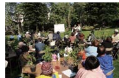
ブーゲンビリアの管理講習会