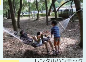
レンタルハンモック

ハンモックで潮風に揺れながら、木もれ日のなかでノンビリとお昼寝や読書。なんとも贅沢なくつろぎのひとときを味わってみませんか。