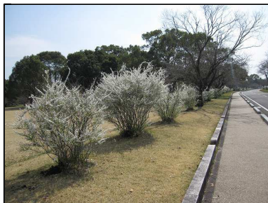
◇まるで雪が降ってるみたい◇

柳のようにしなって伸びる枝に、真っ白で小さな花をたくさん咲かせています。 柳の枝に名前の通り、まるで雪が降っているようですね♪