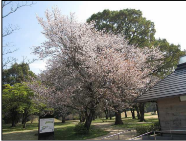
☆ヤマザクラが見頃です☆