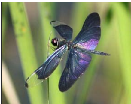
宝石のように光り輝くチョウトンボ

萩の台公園の一角に、昔からの自然をそのまま残したトンボ池ビオトープがあります。ヨシやガマ、カンガレイなど水生植物が生い茂り、水の中ではカエルやメダカが泳ぎ回っています。今月から、宝石のように光り輝くチョウトンボをはじめ、ショウジョウトンボやハラビロトンボたちもやってきました。