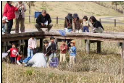
春の観察会の様子