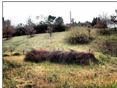
剪定した萩を束ねて粗草積み