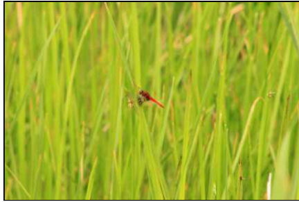
ショウジョウトンボ