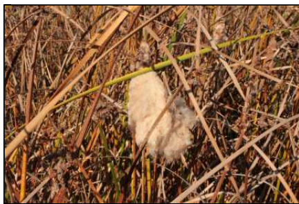
綿になったヒメガマ

スミレ科は世界中に16～17属850種あるそうで、その中でも日本では300種ほどあるそうです。