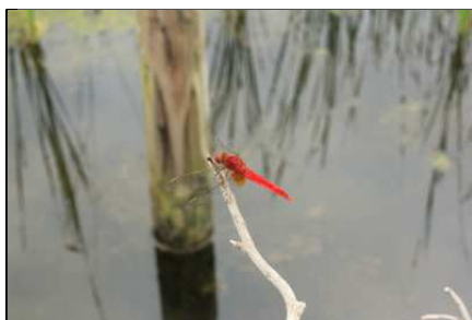
ショウジョウトンボ

和名の由来となっている「ハルシャ(波斯)」はペルシャのこと。別名はジャノメソウ(蛇目草)。