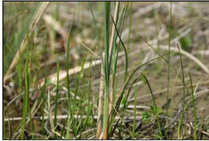
ホソミオツネントンの交尾