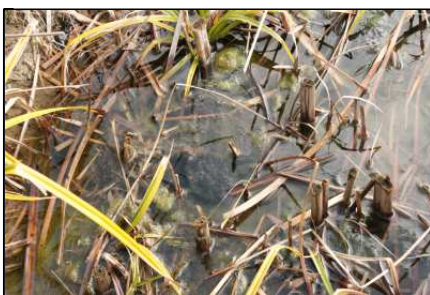
カエルの卵・おたまじゃくし