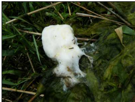
アオガエル科の卵

カエルの姿もあちこちで見られ、4月中旬まで賑やかな鳴き声も聞くことができました。