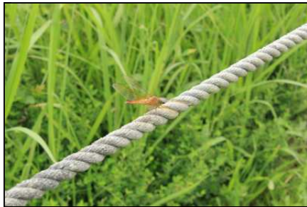
ショウジョウトンボ♀