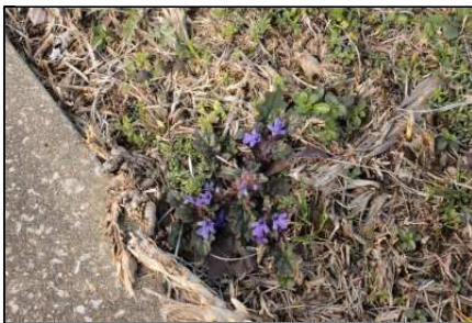
別名 ジゴクノカマノフタ