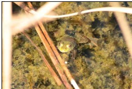
じっとしているカエル

熨斗目(ノシメ)とは、腰と袖の部分だけに縞や格子模様がある織物のことを言うそうです。