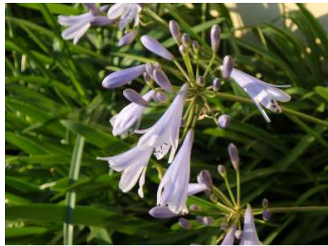
ヒメアガパンサス