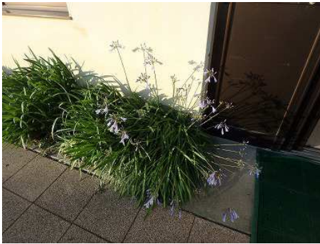
ヒメアガパンサス