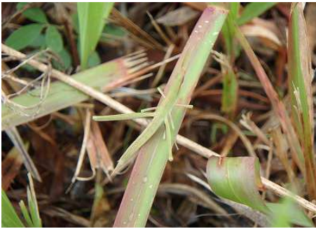
ショウリョウバッタ幼体