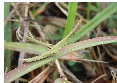
ショウリョウバッタ幼体