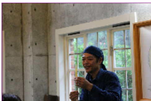
工房ククリ姫 かんさん