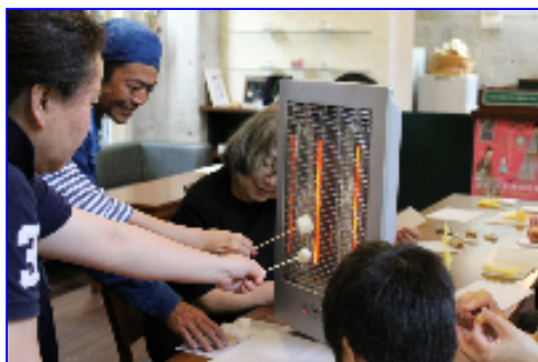
蜜蝋を暖めてます。