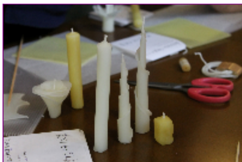
出来上がりました♪