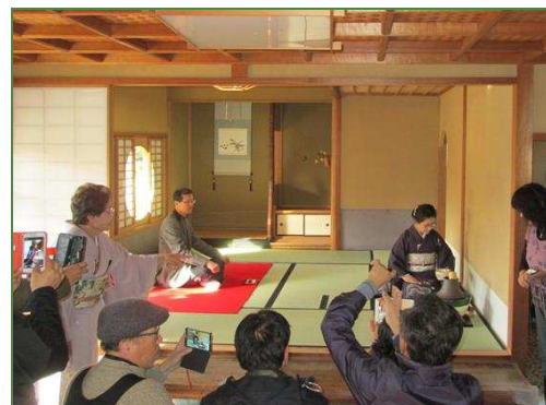
お点前のお披露目中です

今回は両団体の交流が目的ということで、その一環として日本庭園をご利用いただきました。