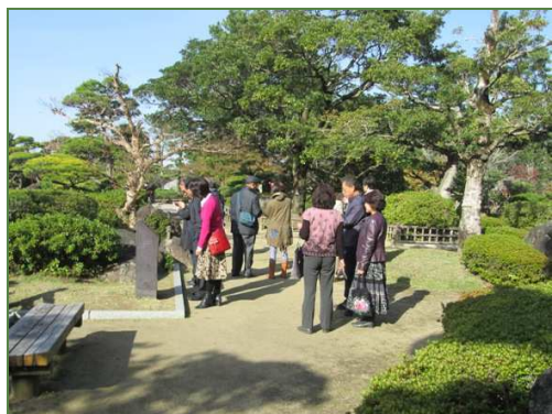
日本庭園の案内板付近です