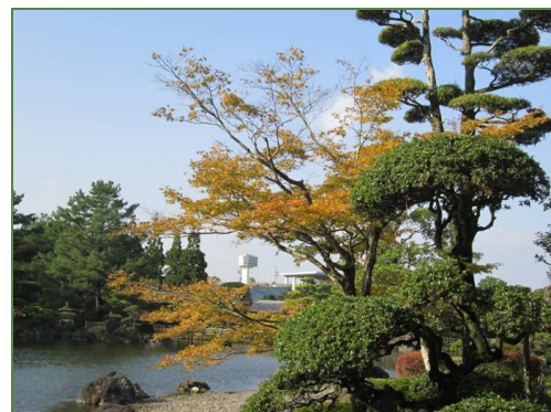
青空に黄色が映えます

紅葉の進行の速さを見ると、見頃は思いのほか短いかもしれません。どうぞお早めに、運動公園内の日本庭園までお越しください。