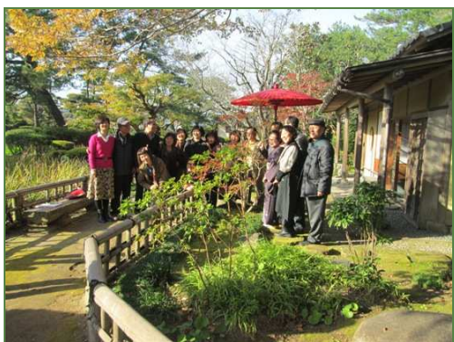
茶室前で記念撮影です