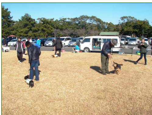
皆さん練習中です