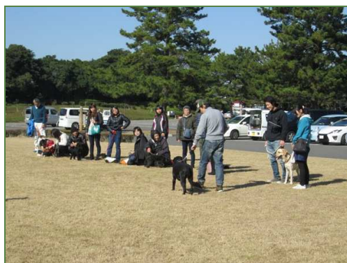
訓練の成果をお披露目です

もちろん、お手本のようにはうまくできませんが、最初は登れなかった台にも上れるようになりました。そんな時は十分褒めてあげることが大事だそうです。