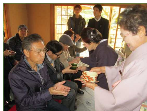
皆さんにお茶がふるまわれました

お茶会の後は、日本庭園内を散策なさり、庭園内の植物などについてもいくつか質問がありました。