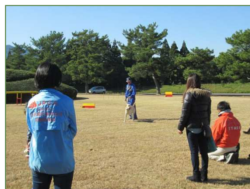
声かけが大事だそうです