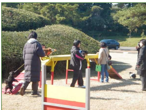
小型犬でも頑張って登ります