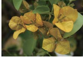
ブーゲンビリア ジュビリー Bougainvillea xspectro-glabra 'Jubilée'