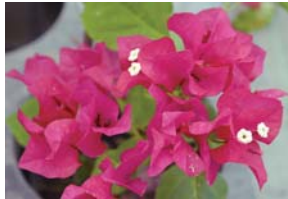
ブーゲンビリア ビジョンブラッド Bougainvillea 'Pigeon Blood'