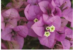
ブーゲンビリア ミセスエバ Bougainvillea 'Mrs. Eva'

ブーゲンビリアは南国イメージを代表する花で、赤やピンクの鮮やかな花色が魅力です。昭和46年以降、シンガポール植物園からいただいた挿枝をもとに育てたもの8品種を中心に16品種を揃えました。アンブレラ状やアーチ状など、仕立て方を工夫しています。