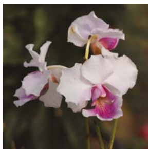
パピリオナンテ ミスジョアキム Papilionanthe Miss Joaquin

昭和40年にシンガポール植物園と姉妹植物園締結して以来、平成19年に天皇后陛下のお名前がつけられた2種類のラン「レナンタンダ アキヒト」と「デンドロビウム ミチコ」、平成27年にシンガポールの国花パピリオナンテ(旧名バンダ)ミスジョアキムが贈呈されました。