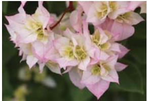
ブーゲンビリア ダブルホワイト Bougainvillea 'Double White'