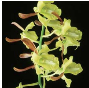
デンドロビウム ミチコ Dendrobium Michiko