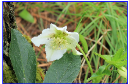
クリスマスローズ

※カフェはこの期間毎日営業ですが、5月の連休に向けて植栽作業を行いますので、4月15日、16日、17日はお休みになります。ご了承ください。