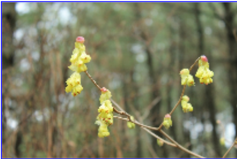
春の息吹を感じさせる「トサミズキ」

英国式庭園では、いつのまにか、枝ばかりだった「トサミズキ」が黄色くかわいい花をつけていたり、葉だけだった「クリスマスローズ」に白や紫の花が咲いていたり、ガーデンハウス入口のツルバラ「アンジェラ」は新芽をたくさんつけはじめたりと春の訪れを感じます。