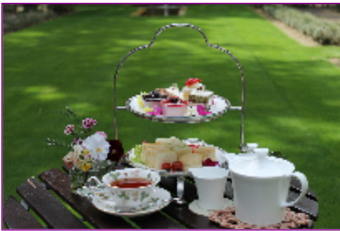
アフタヌーンティーセット

フラワーガーデンショー期間中の土・日・祝日には恒例の「アフタヌーンティーセット」もお楽しみいただけます。