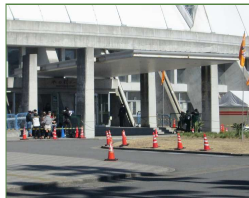
木の花ドーム入り口付近

巨人軍の一部選手の皆さんの自主トレも始まっています。 練習場の木の花ドーム入口付近には、選手を一目見ようという熱心なファンの方々と取材陣が待ち構えていました。