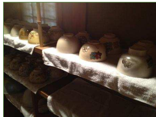
出番を待つ茶碗たち

この日の天気は雨。でも、お茶会では雨の日ならではのおもてなしも…。以前紹介しましたが、床飾りや、花、それをあしらう花入、そして茶碗から、棗(なつめ)、一つ一つに客人へ対する亭主の心が配られている事…。