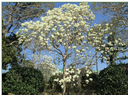
ハクモクレンの樹

暦の上ではとうに春とはいえ、寒い日もまだまだあります。しかし、植物の世界では着実に春はやってきているようで、運動公園のハクモクレンの花が満開になっていました。