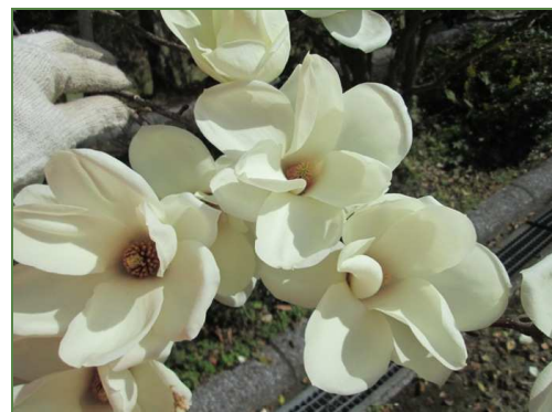
ハクモクレンの花

場所によってはこれから満開になる樹もありそうです。運動公園に春を感じにおいでになってはいかがでしょうか。