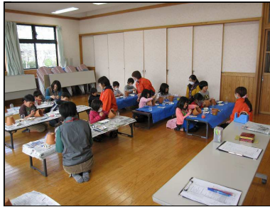
◆ペイント鉢作り開始◆