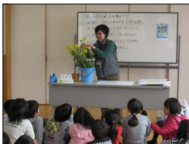
◆菜の花って知ってる?◆

その合間もっと環境に興味を持ってもらえるよう、環境紙芝居「里山ってな〜に?」をお話しました。