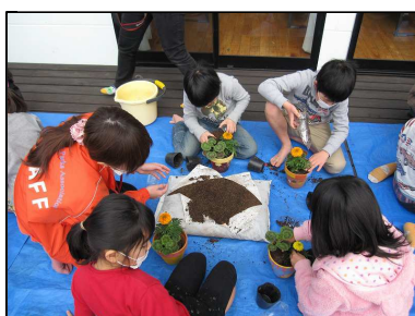
◆寄せ植え作りに挑戦!◆

講師による説明を受けて、底鉢ネットと土を5cmぐらい敷いたらゼラニウムとマリーゴールドの苗を植えました。