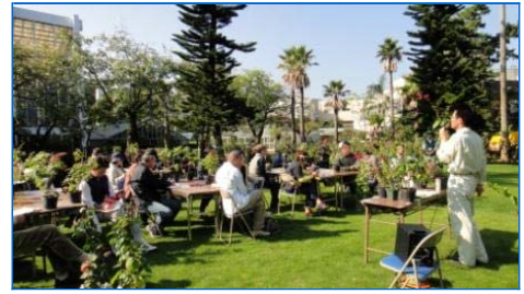
♪ 昨年の講習会の様子です ♪

チューリップの球根植え付け、ブーゲンビリアの講習会に参加希望の方は、事前に下記連絡先までお申し込みください。心よりお待ちしております。