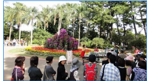
♪ 昨年の様子です ♪

さて、今年も植物園では秋のフラワーショーを開催します♪ 今年地元の方々のご厚意により、青島伝統芸能の「臼太鼓」の披露もありますよ！是非遊びに来られてはいかがでしょうか♪