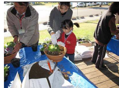
◆作るのって楽しい♪◆