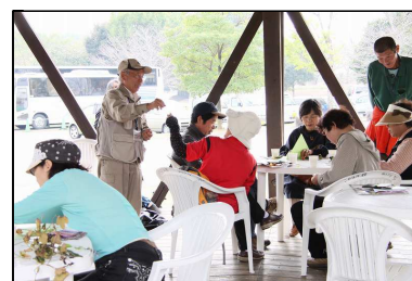
◆先生、皆さまありがとうございました◆ ありがとうございました！

その他にも、二つのドングリの落葉樹と広葉樹の見分け方、クリとクヌギの見分け方など、素人目では一緒に見える物も、先生から特徴や説明を聞くと、参加者の方は驚いたり感心していました。最後に、参加者の方々に先生からタラヨウの葉とムクロジの実のプレゼントがありました♪♪タラヨウの葉の裏に鋭角のものでなぞると黒くなり字が書けるようで、何年経っても消えないんです！