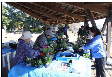
◆鉢に並べていきます◆

今回の寄せ植えは「春まで楽しめる」をテーマに、冬から春にかけてお花を楽しめるようビオラ・パンジーを初め、チューリップ・ムスカリの球根など、計9種類を使用しました！