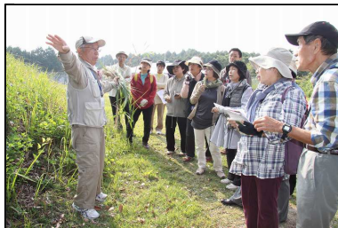
◆見分けるポイントは地下茎◆

脇道にある野草を先生が名前の由来等のヒントを挙げて、名称は何でしょうか？と参加者の方たちに聞かれ、それぞれ考えたり答えていました。先生が正解を含めて特徴を説明されると皆さん顔かれて近くで観察したりメモを取っていました。古墳周辺では、カラスノエンドウや秋の七草のハギ、ノブドウやヤマブドウ、シイやワラビ・ゼンマイ等の様々な野草や樹木が見られました。