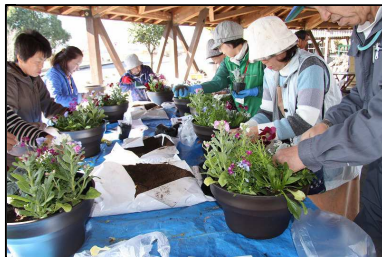
◆場所が決まったら植えます◆

講師による寄せ植えづくりのポイントを聞いて、さっそく作成開始です。まず初めに、ボラ石・土を鉢の底に詰めていきます。次に植える花苗をお一人ずつ鉢の前に用意します。直径36cmの大きな鉢に花苗を並べると、すでにボリュームたっぷりの鉢の様子に皆さん驚かれていました。