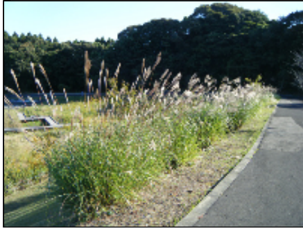
ススキが見頃です