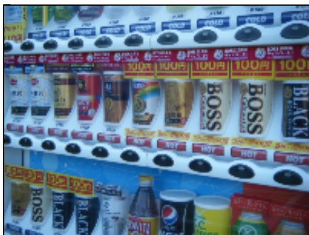
ホットメニューが充実!