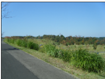
園路沿いのススキ

上記内容をお伝えいただければ、スケジュールを確認します。既に他の団体が入っている場合は、その旨をお伝えします。