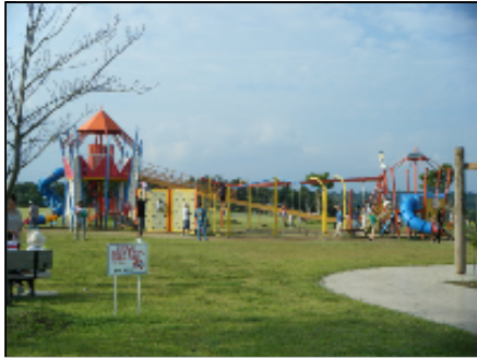
萩の台公園 遊具広場