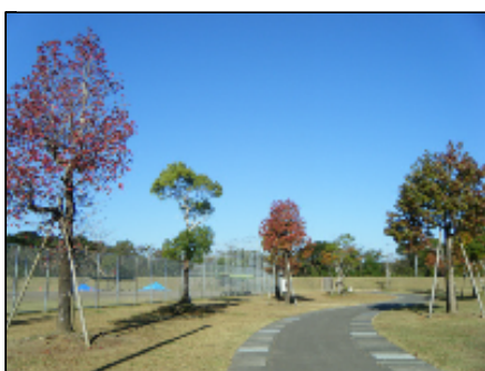
色鮮やかな紅葉と空