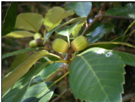
実ってきたドングリ

私ども指定管理者として、利用状況を把握するために、事前に連絡をお待ちしております。