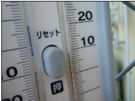
9°C 急に寒くなりました