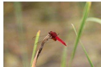
ショウジョウトンボ