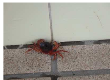
管理棟にカニが出現