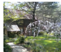
コテージガーデン Cottage garden