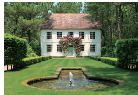
フォーマルガーデン Formal garden