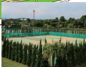
テニスコート Tennis court