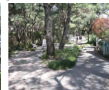
シーサイドガーデン Seaside garden