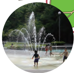
北側ゾーン(噴水広場) North side zone(Fountain area)