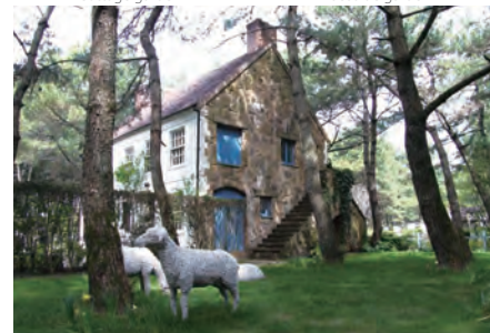
メドウガーデン Meadow garden