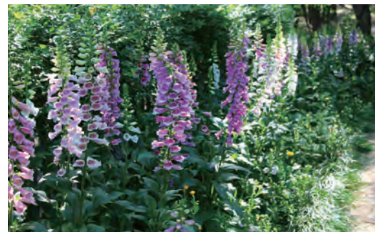
ジキタリス Digitalis cv.