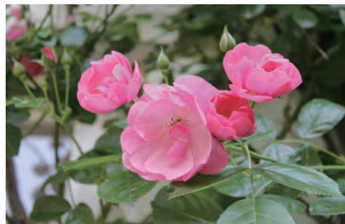
つるバラ アンジェラ Rosa 'Angela'