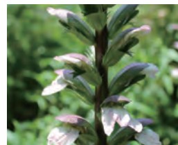
アカンサス モリス Acanthus mollis