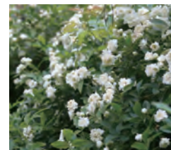
モッコウバラ Rosa banksiae