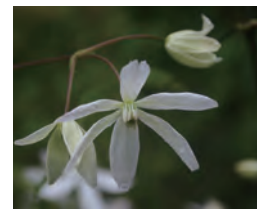
クレマチス アーマンディ Clematis armandii