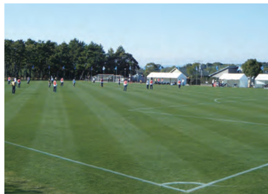
多目的広場 Multi-purpose area