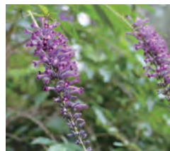
ブuddleia Buddleja davidii