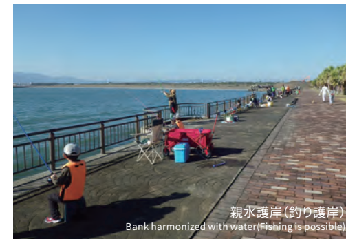
親水護岸 (釣り護岸) Bank harmonized with water (Fishing is possible)

北ビーチ管理棟では、マリンスポーツを気軽に楽しんでいただくため、初心者向けのインストラクションがついたライドプログラムや、ビーチバレーのボールなどスポーツ用品のレンタルを行っています。また、バーベキュー広場、スポーツコート、斜路、水域 (マリンスポーツを楽しむ人) 等の施設を利用する場合はお申し込みが必要です。詳しくは公園HPをご覧ください。