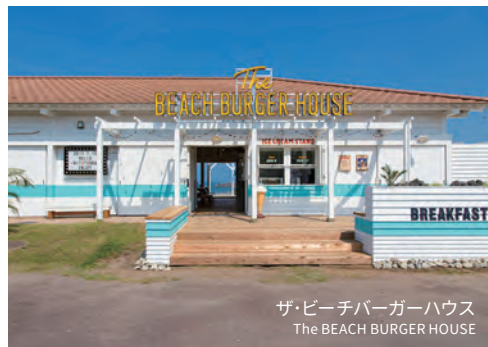
ザ・ビーチバーガーハウス The BEACH BURGER HOUSE