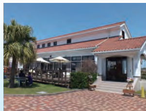
マリンセンター Marine center