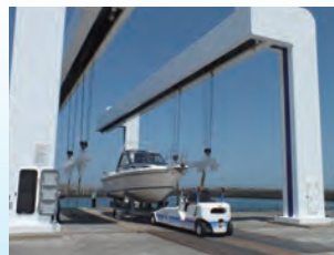
上下架施設 Lift Conveyor