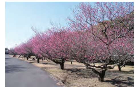
梅園 Japanese Plum Garden