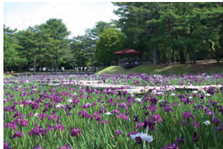
はなしょうぶ園 Hanashobu Garden