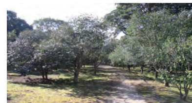
椿園 Camellia Garden