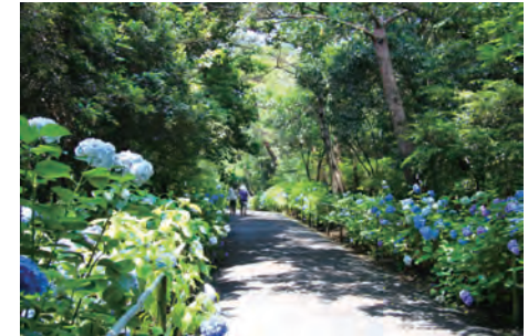
アジサイの道 Hydrangea Path