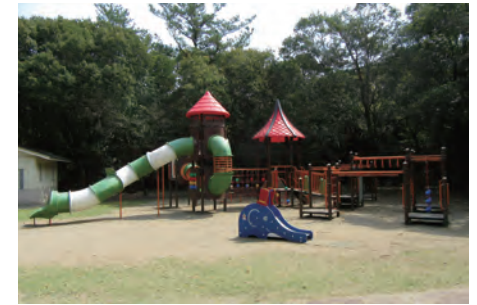
ぼうけん広場 Adventure Playground