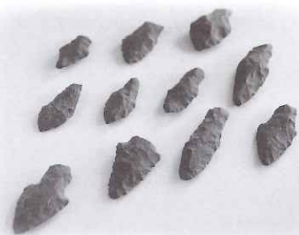
石銛:つぐめのはな遺跡 (平戸市文化交流課)