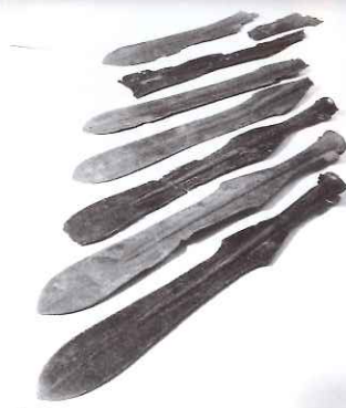
銅矛:増田山遺跡出土 (対馬博物館)