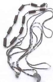
西都原111号墳出土玉類(西都市)

開館20周年 展示会Ⅲ びちからジュエリー 美と権の装身具 ～玉が映した宮崎の古墳文化～