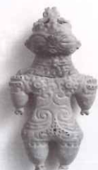
遮光器土偶(高梨遺跡/岩手県)