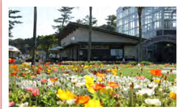
宮交ボタニックガーデン青島

熱帯・亜熱帯植物の群生地として知られる青島神社。宮司によるお話もお楽しみいただけます。