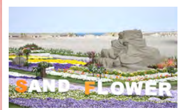
サンドフラワーフェスタ

“春のガーデンパーティー”をデザインテーマにした、華やかでフォトジェニックな空間が登場。 ※THE LIVING GAEDENは通常、宿泊者限定エリアとなりますが、特別にツアーのお客様は入場できます。