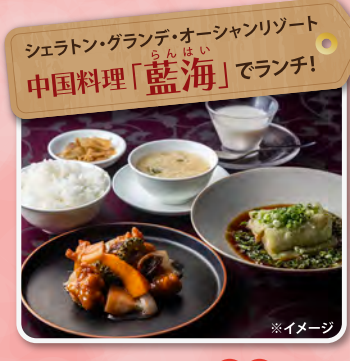
シェラトン・グランデ・オーシャンリゾート 中国料理「藍海」でランチ!

イギリスのトップデザイナーによる美しい庭園とガーデンハウス。まるで絵本の世界に迷いこんだよう。